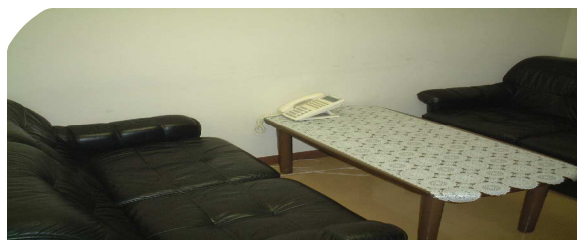
医療相談室長 田畑 キミ

a family』の理念のもと、家族間調整に努めて相談に応じ、必要な援助を行っております。いつでも誰でも気軽にお声をかけて下さい。