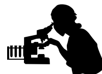
検査室 大場 雄一