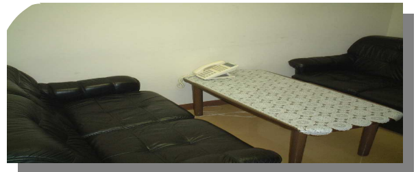
医療相談室長 田畑 キミ

精神科家族会 毎月第3土曜日 14:00～ アルコール家族会 毎月第1土曜日 13:30～