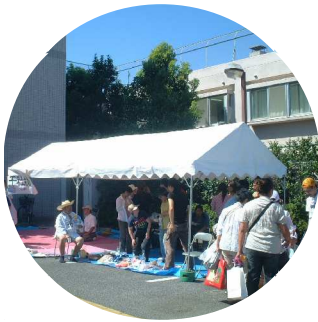
フリーマーケット 今年も大盛況でした