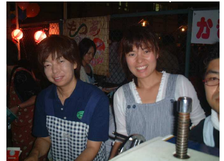
出店おつかれさまでした