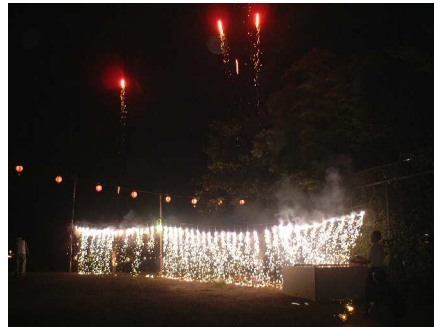
恒例の“ナイアガラ花火”