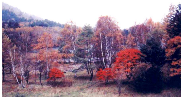
アルコール・デイケア リカバード相談員 斉藤 実