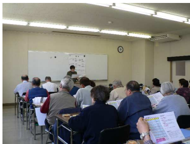
西白井複合センター 研修室にて