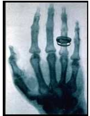
指輪をはめた夫人のX線写真

陰極線の研究をしていたレントゲンは真空管に高電圧を掛けている時に、真空管を厚紙で覆っているにも関わらず、机の上に置いてあった蛍光紙が明るく光ることに偶然にも気付きました。部屋を暗くしてみるとはっきりと分かり、厚紙から洩れていない事は、この光が1000ページもの厚さの本を透過したことからはっきりしました。そこで彼はこの正体不明の光に、数学の未知の数をあらわす「X」の文字を使いX線という名前を付けました。翌年の1月には彼の夫人の手を撮影した写真が、人体X線写真の最初の写真となり、また6年後の1901年にはこの発見の功績を称えられ最初のノーベル物理学賞が贈られました。