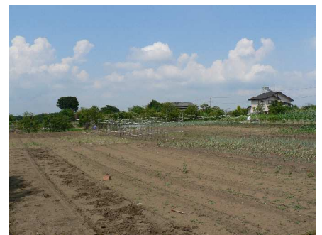
就労継続支援事業B型「あきもとふあーまーず」農地