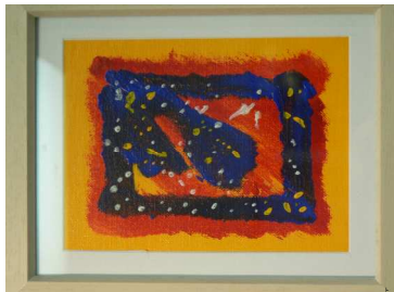
第2回秋元画廊作品 外来待合ホール