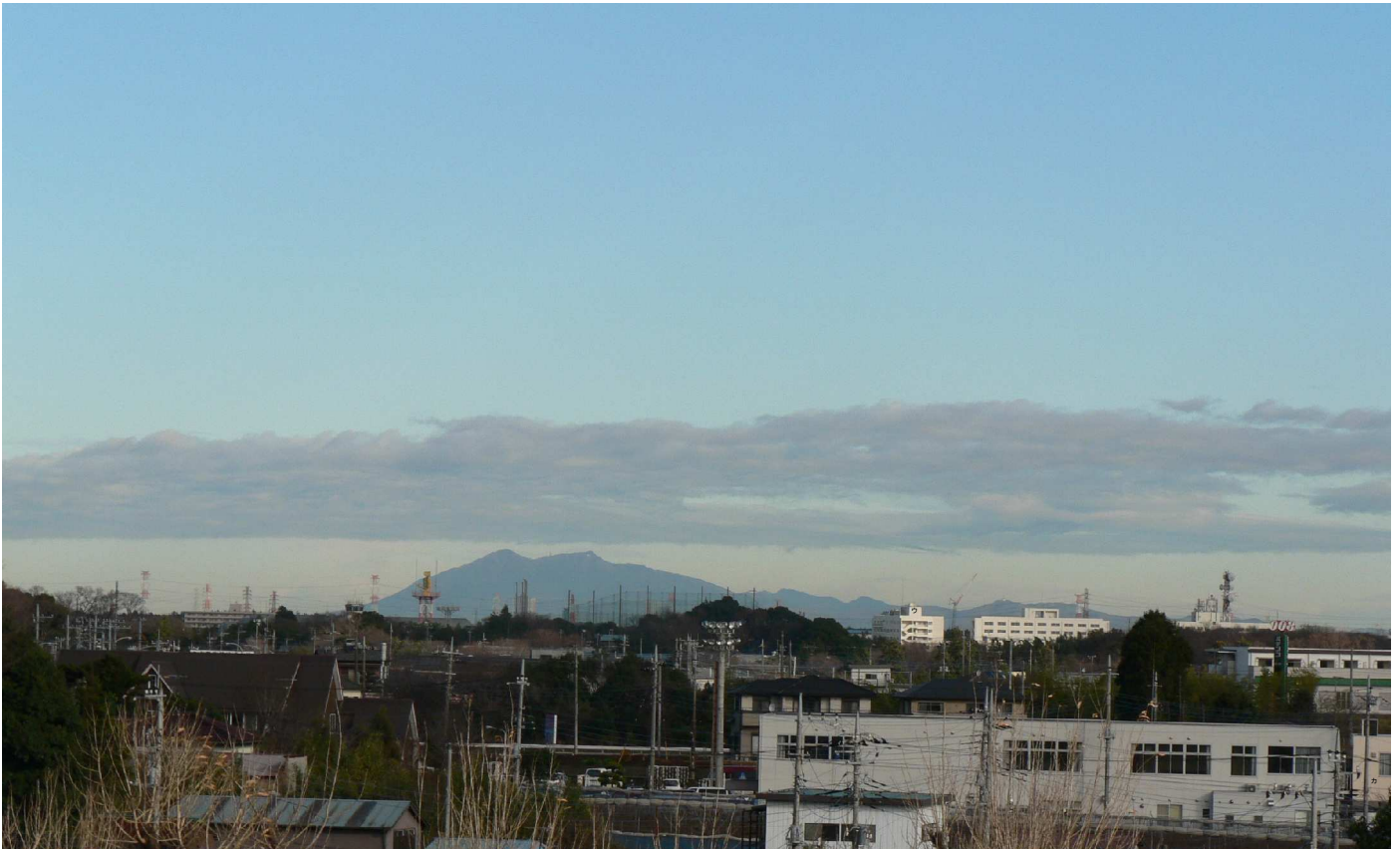
筑波山（新棟屋上から撮影）