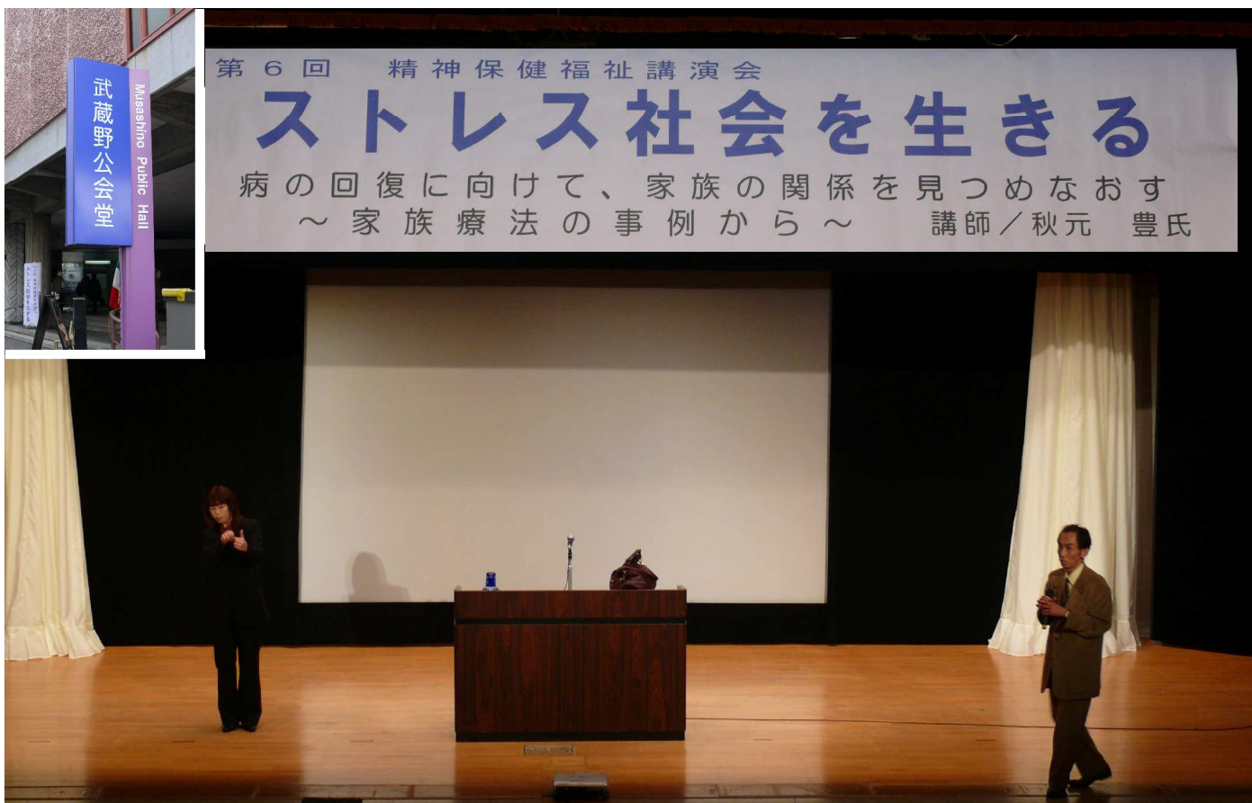
第6回 精神保健福祉講演会 「ストレス社会を生きる」 in 武蔵野公会堂