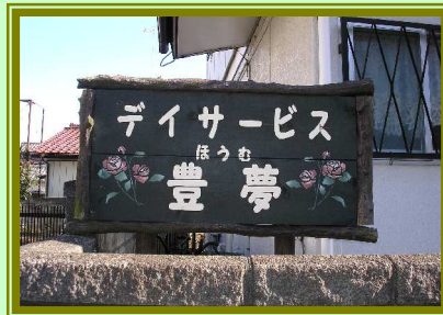
船橋市咲ヶ丘 4-2-1 047-440-2081

ご自宅までの送迎を致します。 入浴 リハビリ、体操 レクリエーション 昼食、おやつ 昼食、おやつは、手作りで提供しております。