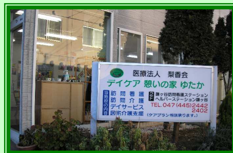
鎌ヶ谷市初富 848-103 047-445-2402